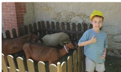
L'ISLE JOURDAIN (Gers) et alentours

Aide, écoute et soutien aux familles d'enfants porteurs de handicap